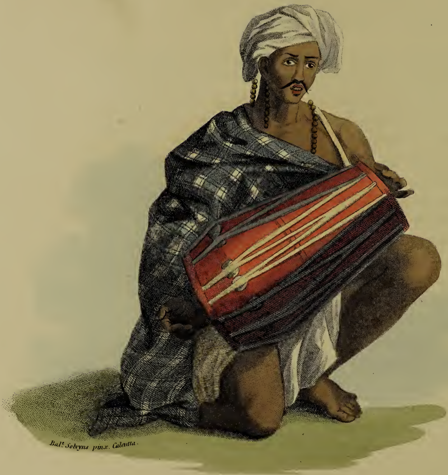
Bal. Solvyns pinx. Calcutta.